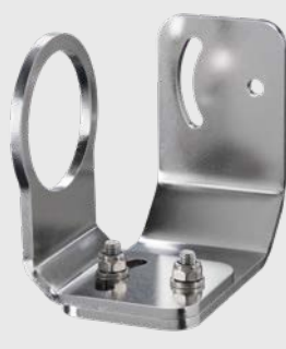
ACCTLAB 2축 조절 가능 마운팅 브라켓