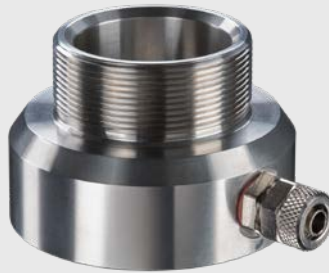
ACCTLAP CxL / CxV 센서용 에어퍼지 장치