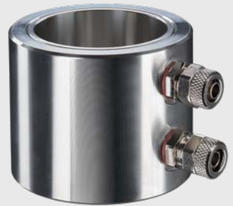
ACCTLW CxL / CxV 센서용 수냉 하우징(스테인리스 스틸, 최대 175 °C)