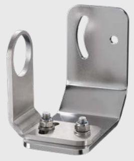
ACCTXLAB CT XL용 2축 조절식 마운팅 브 라켓