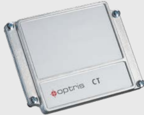
ACCTCOV CT 전자 박스용 밀폐 커버