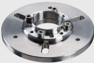
ACHAMA 마운팅 어댑터(장착용 / 파이프 플랜지용)