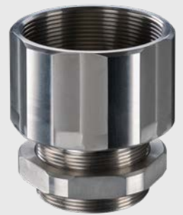
ACCTLTA20UN M48x1.5 → 20 UN-2A 나사 변 환 어댑터(장착 너트 포함)