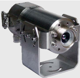
ACCTLCJ CSlaser, CTlaser, CSvideo, CTvideo 센서용 스테인리스 스틸 Cooling