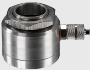
ACCTAPMH CRatio 센서용 에어퍼지 장치