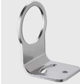
ACCTLFB 1축 조절 가능 마운팅 브라켓