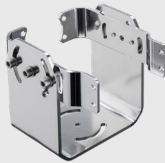
ACCJAB Cooling Jacket용 2축 조절식 마운팅 브라켓