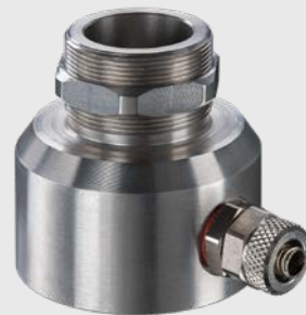
ACCTXLAP CT XL 센서용 에어퍼지 장치